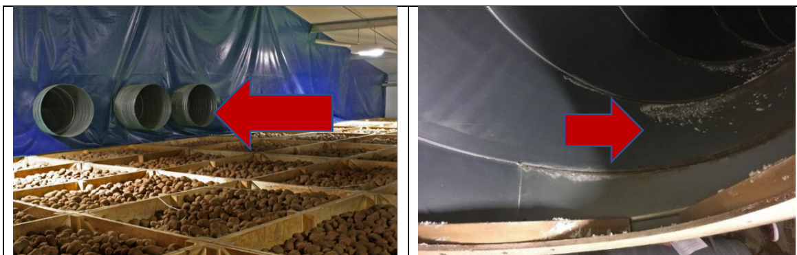
Figuur 4 en 5: Luchtkoeling en luchtgeleidingsbuizen in kistenbewaring.