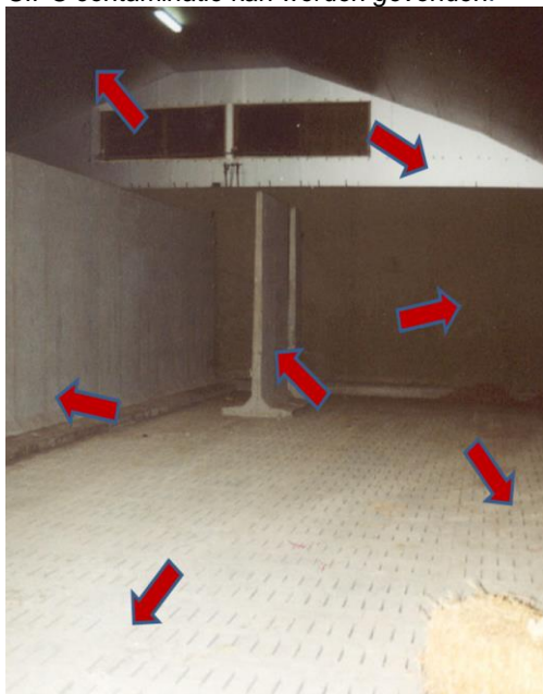
Figuur 2: Plekken in de aardappelbewaarloods waar CIPC contaminatie kan worden gevonden.